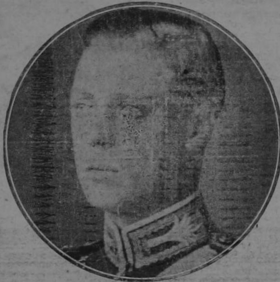
H. M. EDWARD VI.I

great necessity in a mixed population such as ours; but, in reality, the ATLANTIC VOICE is not being supported as it deserves, endeavouring, as we do, to give items of foreign as well as local happenings of importance; the gist of the laws passed in Congress for your information and guidance and to champion your rights against unjust authorities. Now, however, that we have appeared in a mere attractive form and have provided a greater amount of English reading matter, we are hoping we shall be able to claim your unstinted attention, patronage and collaboration. We shall continue to gladly accept all articles in regard to occurrences of public interest in your districts which please address to the Editor, Mr. S. C. Nation, Pox 137, Limon.