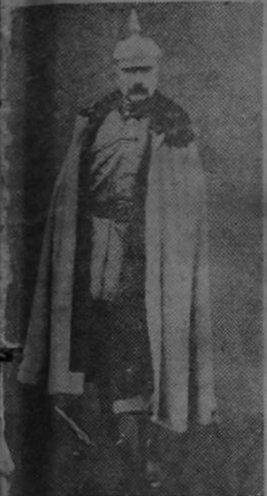
El Kaiser Guillermo II

En una interesantísima entrevista que tuvo George Syvestre Vierick, con el ex-monarca alemán Guillermo II, en su destierro de Doorn, le hizo las siguientes sensacionalísimas declaraciones que resultan de gran actualidad: «En cuanto a Locarno, no creo en la paz europea mientras persista la perfidia de Versalles. Los Tratados de Bucarest y Brest Litovsk son modelos de moderación comparables con los documentos que los aliados y los Estados Unidos hicieron firmar al pueblo alemán. Yo veo con angustia a Alemania bajo las ruedas